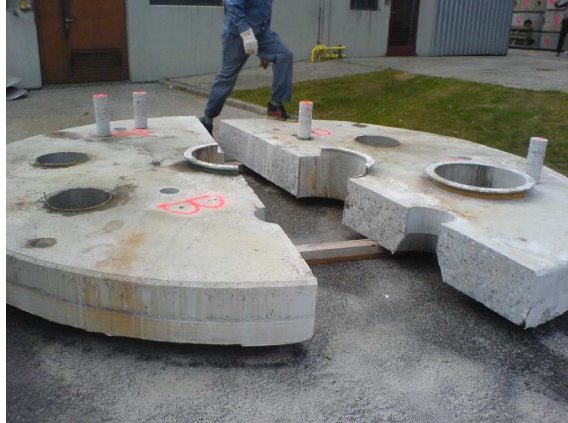
Bohrkernentnahme der Behälterabdeckung