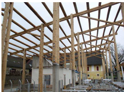
Bauzustand der Tragkonstruktion