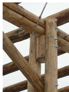
Anschluss der Hauptträger an die Stützen