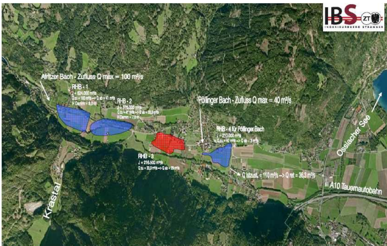
Machbarkeitsstudie mit der Planung von 3 – 4 Rückhalteanlagen für den Hochwasserschutz „Afritzbach“

Das Projekt „Afritzbach“ erstreckt sich über eine Länge von 26,5 km. Im Zuge der Projekterstellung wurde erkannt, dass der gesamte Bereich nur mit massiven Schutzmassnahmen ausreichend gegen Hochwasser geschützt werden kann. Diese bestehen aus Linearverbau inkl. der Planung von drei Rückhaltebecken mit einem gesamten Speicherinhalt von I_{\text{ges}} = 1.25 \text{ Mio. m}^3 . Der als Grundlage dienende Gefahrenzonenplan wurde mittels zweidimensionaler Berechnung auf einer Gesamtlänge von ca. 5 km erstellt.