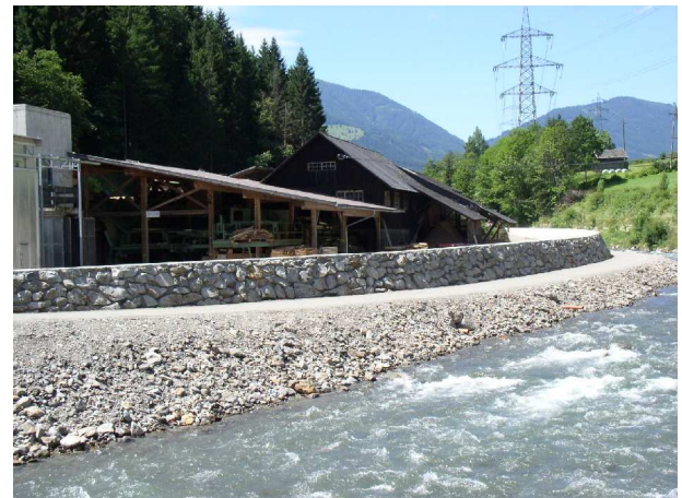
Gewichtsmauern am rechten Ufer zum Schutz des Sägewerkbetriebes